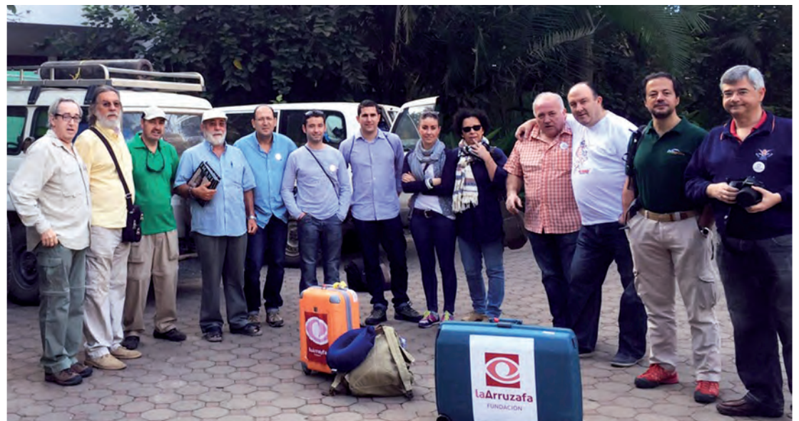
Miembros de la expedición en su llegada a Arusha, Tanzania

La Fundación La Arruzafa es una organización sin ánimo de lucro dedicada a la prestación de asistencia socio-sanitaria en