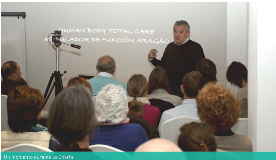
Un momento durante la Charla

Durante su estancia en Córdoba ha vuelto a impartir en Clínica Dental Moreno Cabello un curso básico y avanzado sobre su sistema de trabajo llamado HUMAN BODY TOTAL CARE-RFA al que han asistido 12 profesionales de distintas regiones españolas.