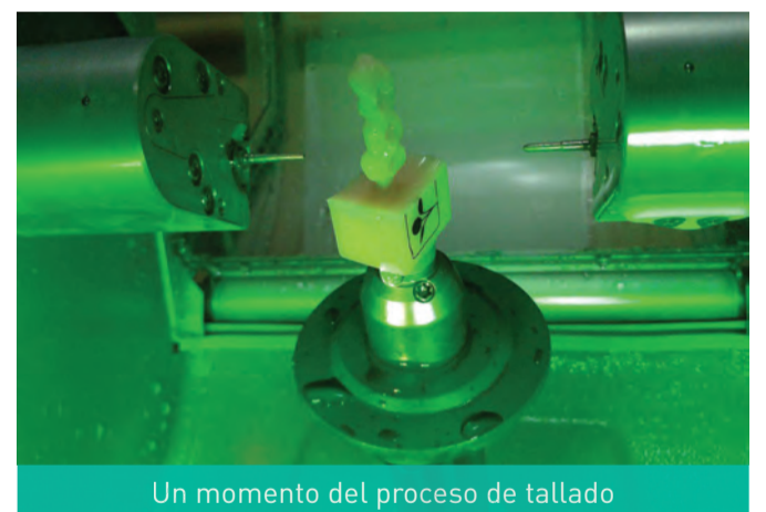
Un momento del proceso de tallado