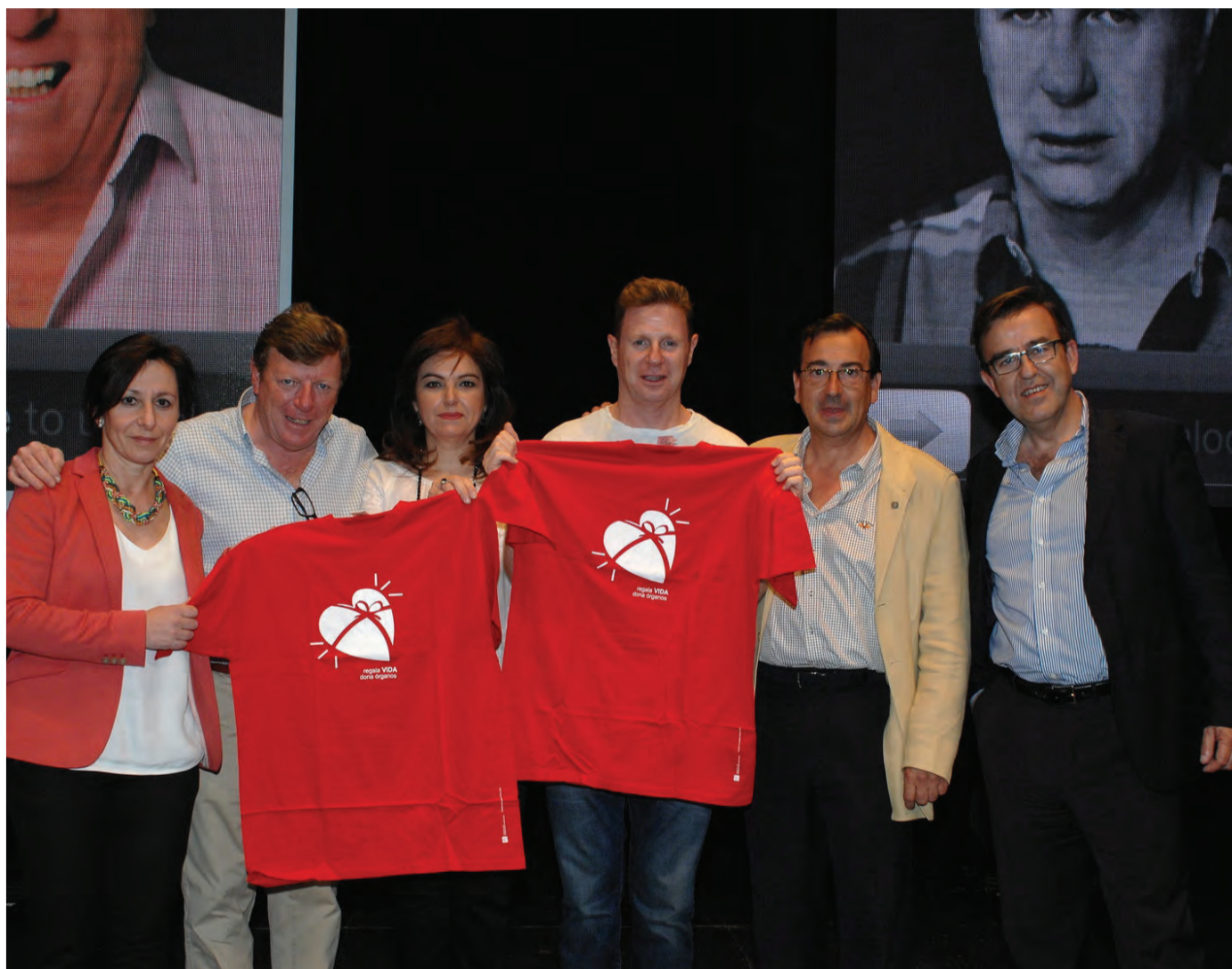
Los Morancos animan a la donación junto a representantes del Hospital Reina Sofía

Las palabras de Los Morancos ya engrasan la lista de llamadas a favor de este acto que permite que la campaña de promoción de la donación de órganos siga creciendo mes a mes. Además, todas las actividades de este año se incluyen en la celebración de una efeméride: el 35 aniversario de la realización del primer trasplante en Córdoba.