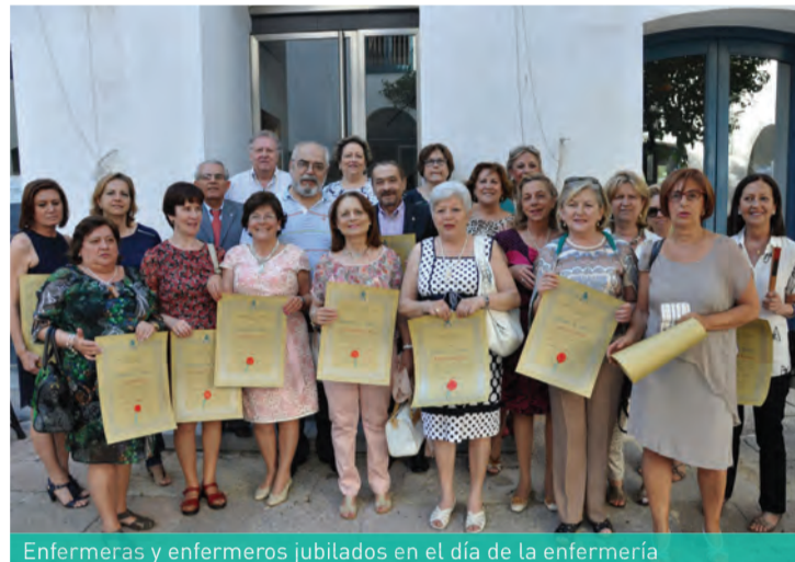
Enfermeras y enfermeros jubilados en el día de la enfermería

El homenaje anual del Colegio a las enfermeras y enfermeros jubilados ha servido como celebración del Día de la profesión, así como la exposición Una Ventana al Sur , con la que la ONG del Consejo General de Enfermería, Enfermeras para el Mundo, muestra en la sede colegial la situación de salud de algunos países en vías de desarrollo a partir de la mirada y los testimonios de sus voluntarios y sus cooperantes.