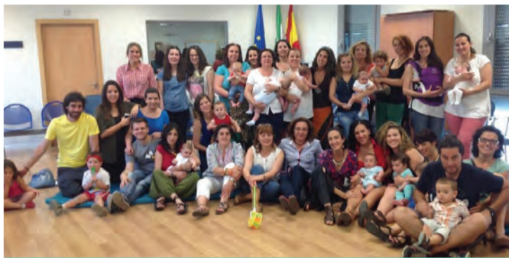
Asistentes a la jornada de puertas abiertas

Se han desarrollado varios talleres de promoción de la salud amenizada con actividades culturales