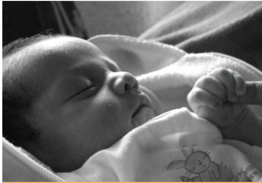
Es importante que los niños tiendan a autorregular sus horas de sueño de forma natural

Hasta el tercer mes, no suele ser posible establecer rutinas de sueño distintas a las naturales, aunque sí que es conveniente comenzar lo antes posible a intentar hacerlo, forma gradual. Por ejemplo, podemos usar rutinas de baño, paseos y comidas.