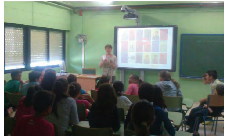
Charlas que se están llevando a cabo en varios centros escolares cordobeses