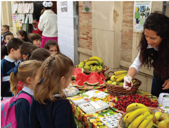
Repartiendo fruta e información entre los infantes en la plaza de la corredera

Mercacórdoba se adhiere al programa «Primavera Saludable» promovido por el Área Municipal de Salud