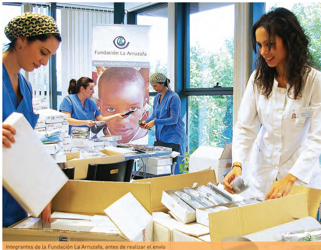
Integrantes de la Fundación La Arruzafa, antes de realizar el envío

La fundación, que colabora con la organización Fundebe (Fundación para el Desarrollo de Benín), encargada de llevar a cabo proyectos humanitarios en esa zona del planeta, prosigue así su compromiso y labor benéfica en luga-