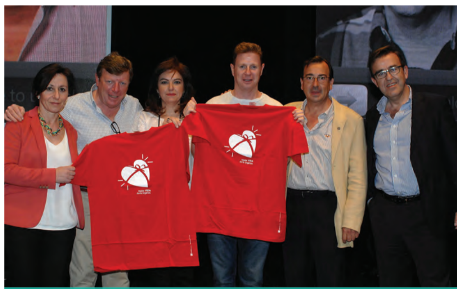
Los Morancos animan a la donación junto a representantes del Hospital Reina Sofía

Los Morancos han sido los últimos rostros conocidos en sumarse a la campaña de promoción de la donación de órganos del Hospital Universitario Reina Sofía de Córdoba. Los hermanos César y Jorge Cadaval, que han renovado su compromiso, consideran «importantísimo» hacerse donante de órganos y que la población sea generosa y regale vida. El dúo de humoristas considera la donación «una herencia maravillosa que debemos dejar cuando los órganos ya no nos sirvan»