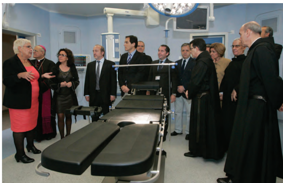
Explicación durante el acto de inauguración del Sn Juan de Dios en Córdoba