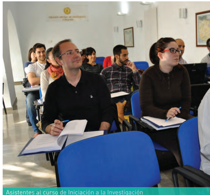
Asistentes al curso de Iniciación a la Investigación

Así, el curso de Iniciación a la Investigación pone de relieve la importancia de la labor investigadora para la profesión. Serrano Merino destaca que «la única