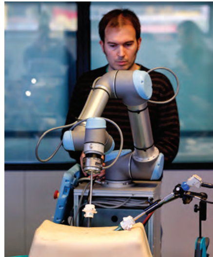
Relajando pruebas con el prototipo de robot

El proyecto BROCA, responsable del desarrollo del prototipo, está dirigido por el Instituto Maimónides de Investigación Biomédica de Córdoba (IMIBIC). BROCA fue concedido por el Ministerio de Economía y Competitividad (MINECO) en 2012 a la Universidad de Córdoba a través del procedimiento de Compra Pública Precomercial y su financiación asciende a 1,8 millones de euros. Estos fondos proceden