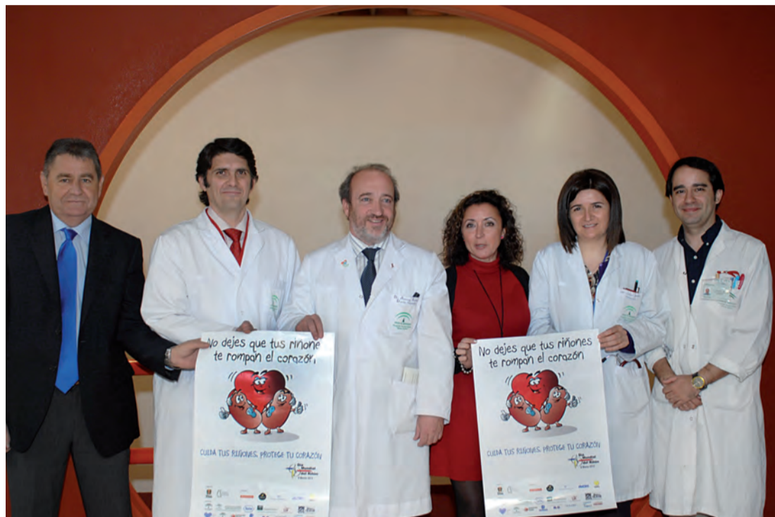
La delegada de salud acompaña a los profesionales del hospital en la celebración del Día Mundial del Riñón

El trasplante se considera el tratamiento más adecuado para la enfermedad renal crónica,