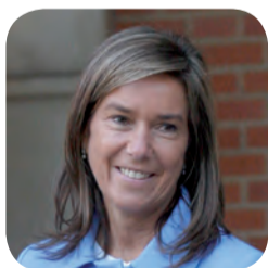
Ana Mato Ministra de Sanidad, Servicios Sociales e Igualdad

► Ha presentado un nuevo tratamiento de 'micro-monovisión', que permite, con una sencilla operación, recuperarse de la presbicia de una forma mucho más confortable para el paciente que con la monovisión clásica.