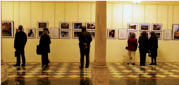
Imagen de la exposición