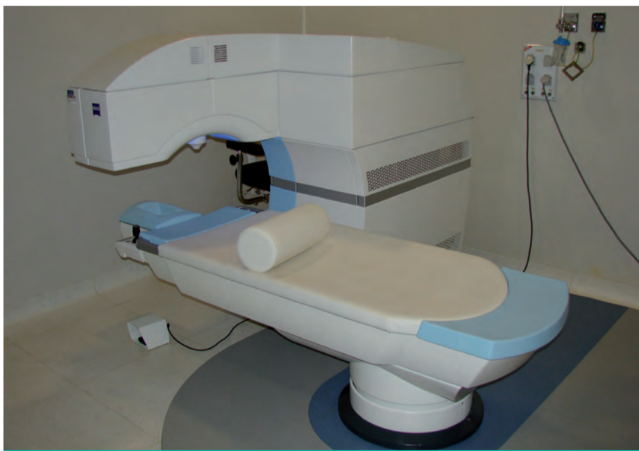
El láser de femtosegundo VisuMax de Carl Zeiss, recientemente adquirido

“ Al referirnos a la presbicia o ‘vista cansada’, siempre hablamos de pacientes que ya sufren fallos en su visión de cerca, por tanto suelen ser personas de más de cuarenta años. ”