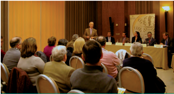
Imagen del acto

La actividad contó con la presencia de cuatro «expertos» del ámbito de la investigación en las redes europeas y nacionales