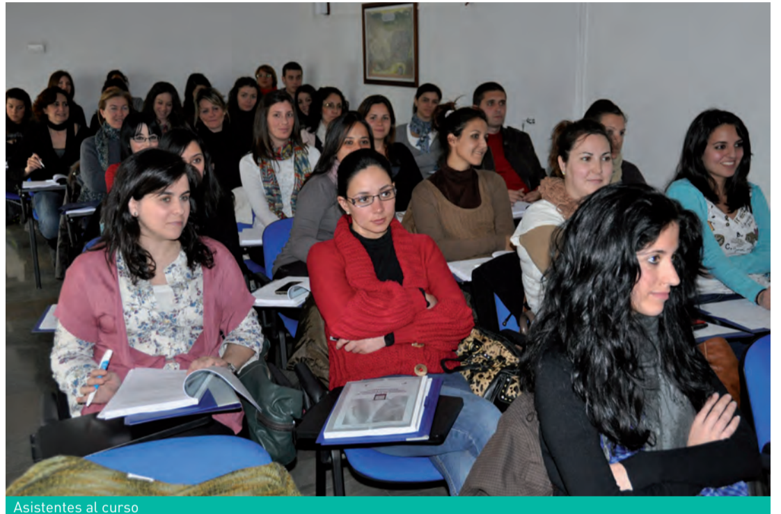
Asistentes al curso

Se incluyen otros contenidos como, la diabetes, la patología del tiroides y otras enfermedades endocrinológicas, como la enfermedad de cushing