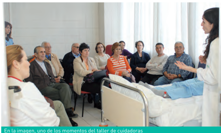
En la imagen, uno de los momentos del taller de cuidadoras

Los talleres ayudan a afrontar la tarea a las personas que tienen a su cargo los cuidados de un familiar enfermo que no puede valerse por sí mismo. El contenido de estos cursos se centra en conocimientos básicos sobre el cuidado, asertividad, cómo reducir la ansiedad y mejorar la autoestima, recursos socio-sanitarios, higiene postural y movilización de pacientes. Por su parte, los fisioterapeutas del hospital también participan en estos talleres para enseñar a las cuidadoras cómo ha de ser el manejo del enfermo a fin de prevenir lesiones musculoesqueléticas y o ofrecerles técnicas de movilización para evitar lesiones.