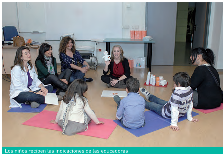
Los niños reciben las indicaciones de las educadoras

Otro truco para calmar el picor es el frío, por lo que se les invita a utilizar abanicos o bolsas de gel frío, entre otros materiales. El contacto con la piel en sustitución del rascado puede realizarse con aparatos de masaje como rodillos suaves de madera, aplicando la palma de la mano sobre la zona, presionando, palmeando o frotando suavemente con la yema de los dedos en sustitución de las uñas.