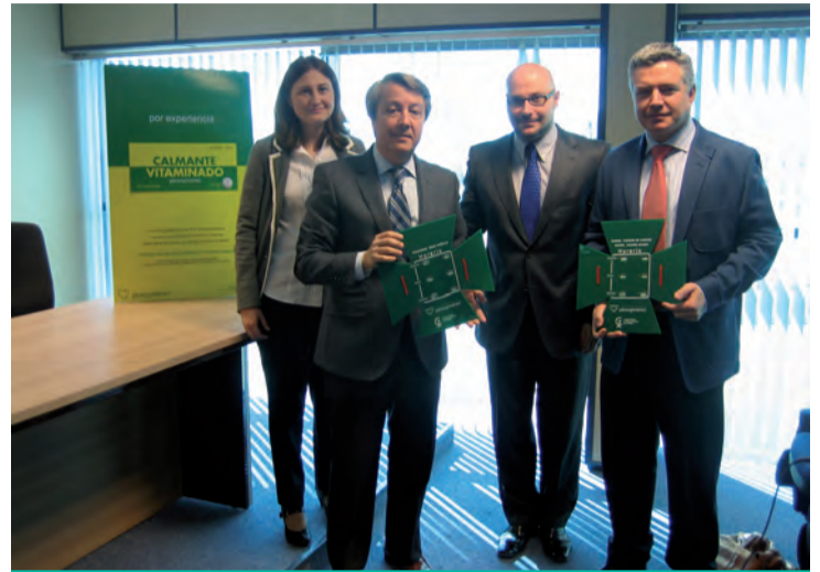
Foto del acto de entrega

Gracias a una colaboración estrecha entre Pérez Giménez y el Colegio Oficial de Farmacéuticos