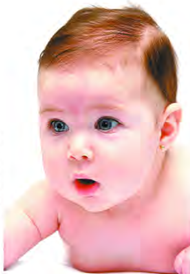
Hay que detectar el aumento del tamaño de las vegetaciones

La operación de las vegetaciones hipertrofiadas recibe el nombre de adenoidectomía y estará indicada cuando se presentan complicaciones que no responden al tratamiento médico habitual como son la otitis media aguda recurrente u otitis media crónica secretora, que a largo plazo puede provocar sordera. Otro de los casos es cuando se detectan adenoides obstructivas que producen apnea del sueño y por tanto, falta de descanso en el niño. Por último, cuando hay malformación craneofacial.