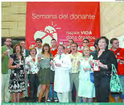
Imagen de un acto de la campaña de donación de órganos celebrada en 2009

También se alcanzó el mayor número de trasplantes de órganos y tejidos realizados en el hospital Reina Sofía, al efectuarse 275 intervenciones