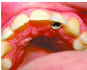
2.1 Carga inmediata. Colocación de implante 2.2 Carga inmediata. Estética dental 2.3 Carga inmediata. Colocación de prótesis sobre implante