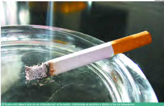
El humo del tabaco que no es inhalado por el fumador, contamina el entorno y afecta a los no fumadores

Una persona que fuma, inhala sólo un 15% del humo total que su cigarro produce. El 85% restante va al ambiente. Esta es sólo una de las 20 razones que esgrime la campaña "¿Por qué nosotros no? Acción Ciudadana por la Salud y el cambio de la Ley de Tabaco", en la que colabora la Organización Médica Colegial (OMC), en apoyo a la modificación legislativa so-