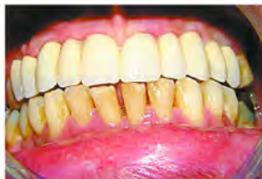
1.1 Colocación de implantes mediante cirugía mínimamente invasiva 1.2 Colocación de prótesis sobre implantes. Estética dental 1.3 Colocación de prótesis sobre implantes