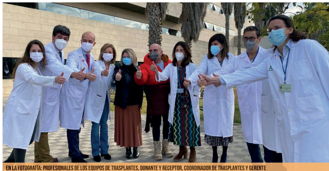
EN LA FOTOGRAFÍA: PROFESIONALES DE LOS EQUIPOS DE TRASPLANTES, DONANTE Y RECEPTOR, COORDINADOR DE TRASPLANTES Y GERENTE

En el apartado de las donaciones, en 2021 se registraron 32 donaciones multiorgánicas (12 de ellas en asistolia), dos más que en 2020. La aceptación familiar a la donación fue del 86,5% (algo por encima de la media andaluza) y la tasa de donación se sitúa en la provincia de Córdoba en 41,6